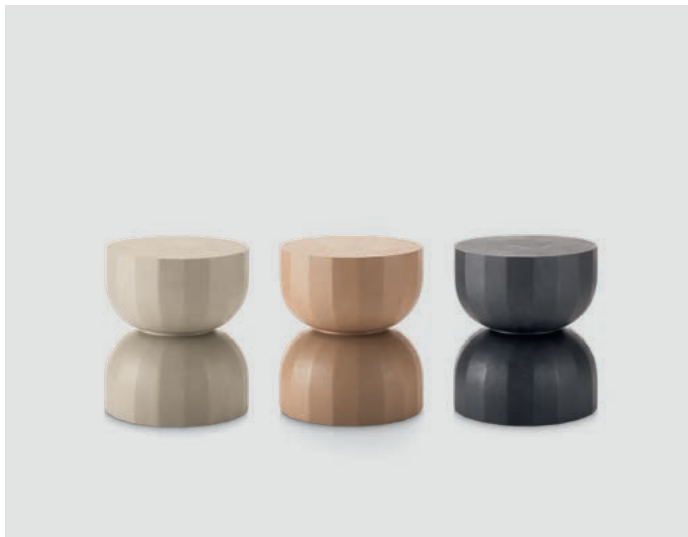
Tavolini Teo 40 cm Cemento, Terra e Ardesia

Teo low tables 40 cm Cement, Earth and Slate